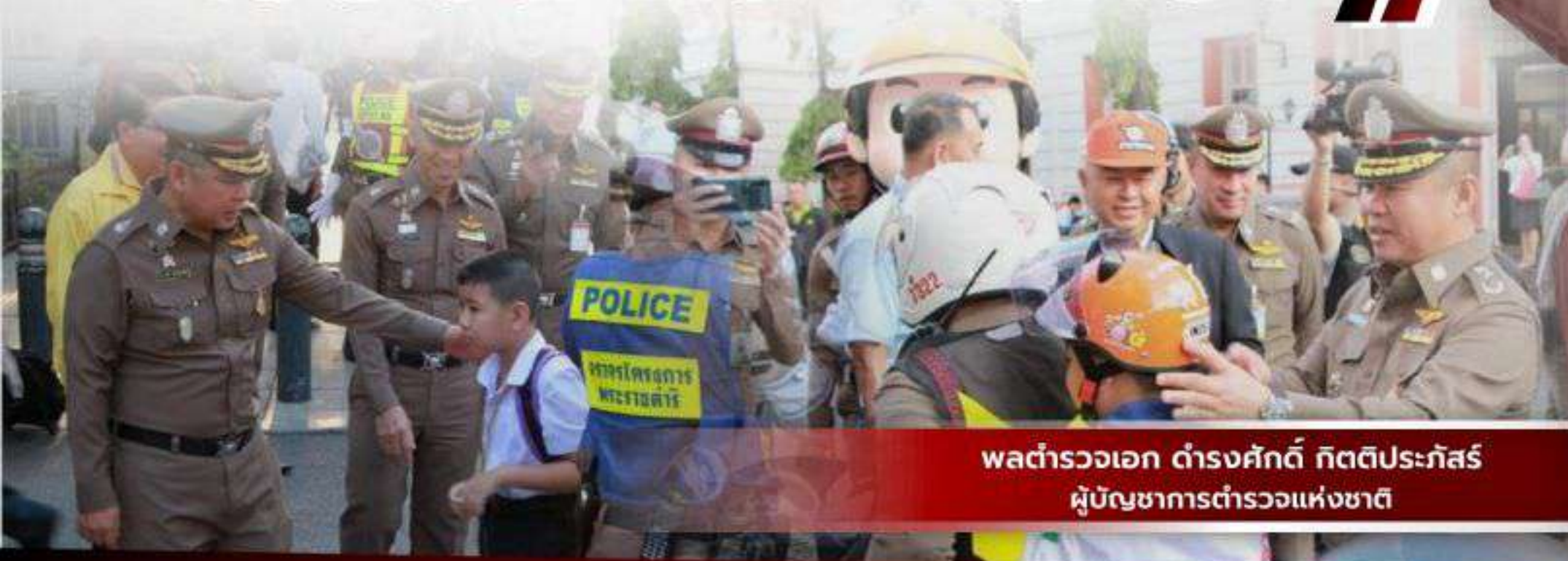
พลตำรวจเอก ดำรงศักดิ์ กิตติประภัสร์ ผู้บัญชาการตำรวจแห่งชาติ