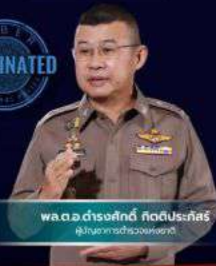
พล.ต.อ.ดำรงศักดิ์ กิตติประภัสร์ ผู้บัญชาการตำรวจแห่งชาติ